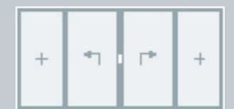
3 hefschuifvleugels, 2 vaste ramen