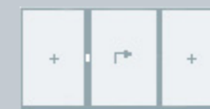
2 hefschuifvleugel, 2 vaste ramen